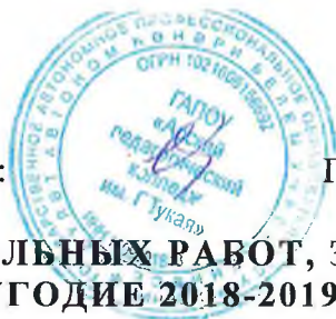
ГРАФИК КОНТРОЛЬНЫХ РАБОТ, ЗАЧЕТОВ И ЭКЗАМЕНОВ НА II ПОЛУГОДИЕ 2018-2019 УЧЕБНОГО ГОДА Специальность 09.02.03 Программирование в компьютерных системах